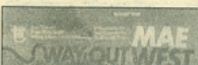
MAE SWAYOUT WES

Vescovi, Dany: Della Pina, Pietrasa (2.500-6.500 €) Vespignani, Renzo: Il Triangolo, C Vetruigno, Maurizio: Carbone.to (4.000-20.000 €)