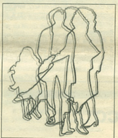
Simona Uberto, Fioretto (Padova), 5.000 €

Uberto, Simona: Fioretto, Padova; *Melesi, Lecco (400-3.500 €)