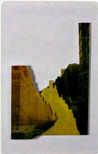
"Fata Morgana 9"

2017, cm 38,5x53,5, stampa fotografica su poliplot sagomato.