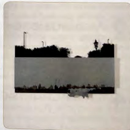
"Fata Morgana 5"

cm 55x130 2017, stampa fotografica su alluminio spazzolato e sagomato